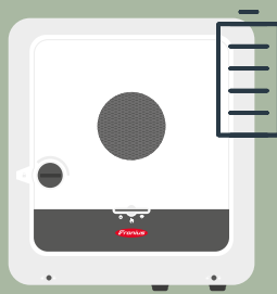
Fronius GEN24 Plus